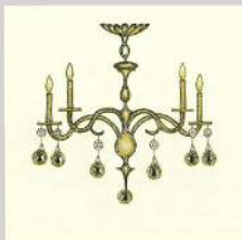
シャンデリア 品番/GGE28 コード/4571290307804