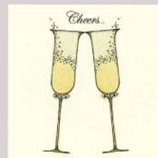
グラス(2個) 品番/GGE21 コード/4571290307811