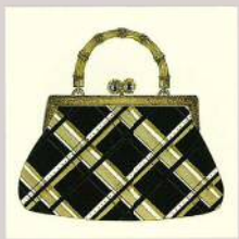
バッグ(チェック) 品番/GGE50 コード/4571290308030