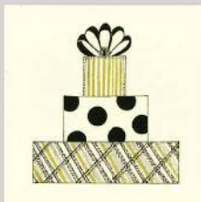
プレゼント 品番/GGE29 コード/4571290307835