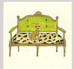
ソファーと犬 品番/GGE23 コード/4571290307781