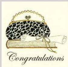
バッグ(Congratulations) 品番/GGE27 コード/4571290307798