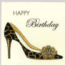
ヒール(HAPPY Birthday) 品番/GGE8 コード/4571290307828