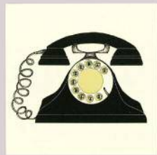
黒電話 品番/GGE31 コード/4571290308061