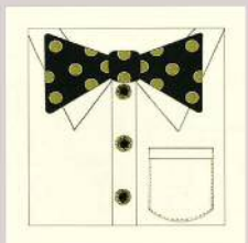
蝶ネクタイ(ドット) 品番/GGE48 コード/4571290308016