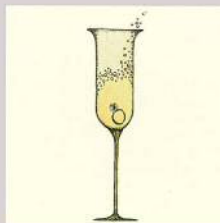
グラス(1個) 品番/GGE20 コード/4571290307996