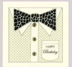
蝶ネクタイ(HAPPY Birthday) 品番/GGE41 コード/4571290308009