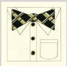
蝶ネクタイ(チェック) 品番/GGE49 コード/4571290308023