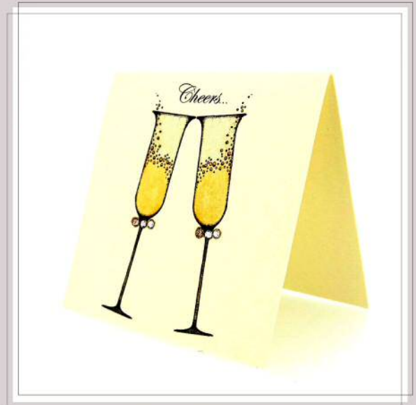
二つ折りカード・封筒付き・スワロフスキークリスタル付き

サイズ/(カード)W70xH70mm(封筒)W79xH79mm パッケージ/袋入り クリーム色