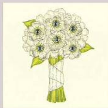
ブーケ 品番/GGE13 コード/4571290307989